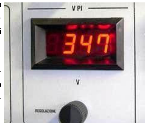
Esempio di applicazione del Modulo Indicatore Digitale